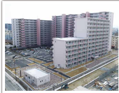
西喜連第5住宅5号館建設工事 設計者: 大阪市 完成日: 2016年2月 構造・規模: RC造・14F・施工床面積13,075.72㎡