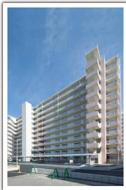
瓜破東住宅3号館建設工事 設計者: 大阪市 完成日: 2016年2月 構造・規模: RC造・11F・ 施工床面積9,680.45㎡