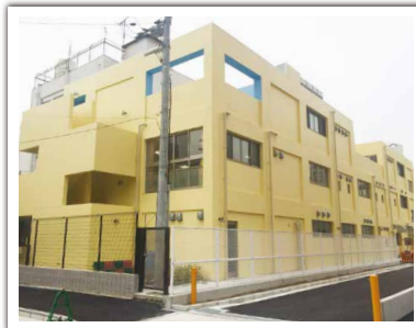
天宗瓜破東園建設工事(第1期) 設計者: (株)貴志環境企画室 完成日: 2015年12月 構造・規模: RC造・3F・施工床面積1,260.25㎡