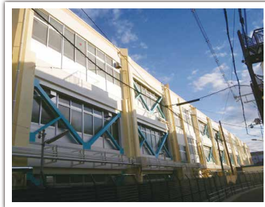
八雲小学校③棟校舎耐震補強工事 設計者: (株)エム・ケイ設計事務所 完成日: 2016年3月 構造・規模: RC造・3F・施工床面積2,054.5㎡