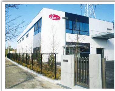
S社 名塩工場新築工事 設計者: (株)服部建築事務所 完成日: 2016年1月 構造・規模: S造・2F・施工床面積1,854.23㎡