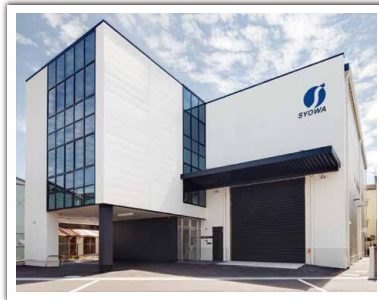
S社 新社屋新築工事 設計者: (株)服部建築事務所 完成日: 2015年8月 構造・規模: S造・3F・施工床面積892.10㎡