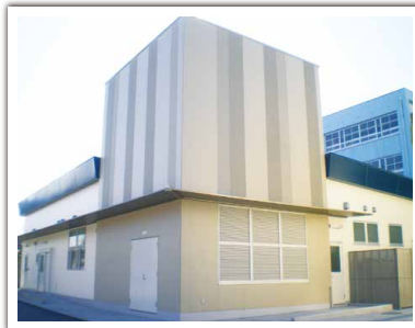
門真市立第四中学校給食棟建替工事 設計者: 門真市 完成日: 2016年3月 構造・規模: S造・1F・施工床面積441.14㎡