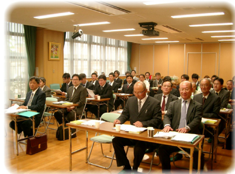
年度経営計画発表会のもよう