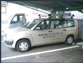
森長工務店メンテナンスカー

「常に早い対応にいつも助か っております。たまに無理難 題を言わせていただきますが 親身になって応えてくださる ので、いつもつつい甘えて しまいます。」