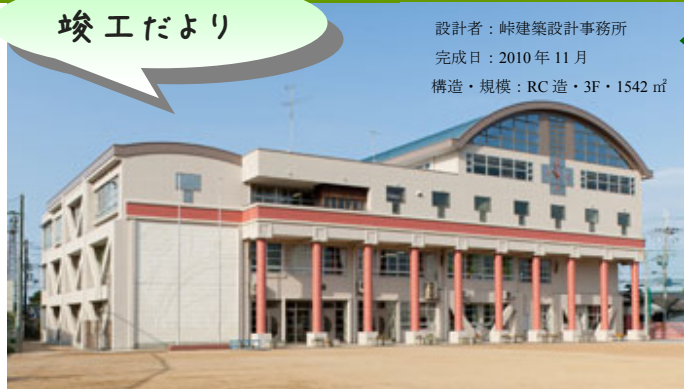
設計者：峠建築設計事務所 完成日：2010年11月 構造・規模：RC造・3F・1542㎡

泉佐野市上之郷小学校耐震補強・改修工事 児童の安全確保・学習環境の確保・通学時交通安全などのニーズに応え、また竣工式では生徒たちから花束やお手紙をいただき、岩丸監督も思わず涙・涙。