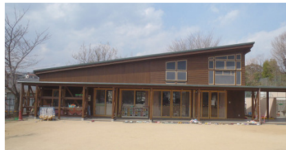
福) しらゆり会のばたけ保育園 耐震補強に伴う大規模改修・増築工事 設計者：(株) いるか設計集団 完成日：2011年3月