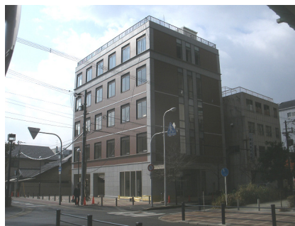
大阪工業大学大宮学舎新築 設計者：(株) 藤原建築事務所 完成日：2011年2月 構造・規模：S造・5F